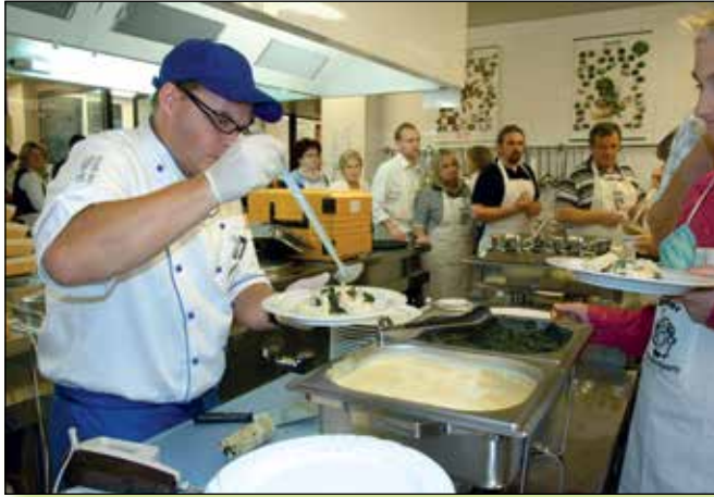
Küchenparty in der Krankenhaus-Cafeteria