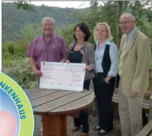
500 € Spende von der Sparkasse EMH