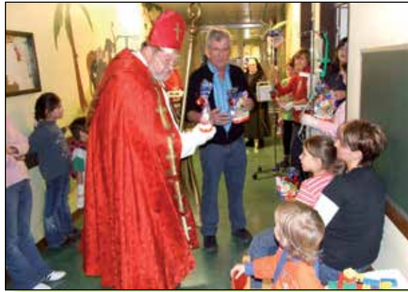
Der Nikolaus kommt alljährlich ins Krankenhaus...