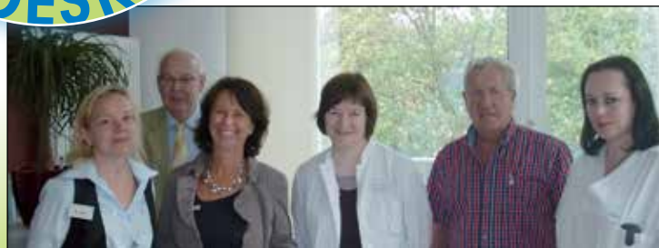
Freundeskreis spendet 5.000 € für die Palliativstation